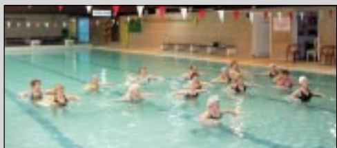
L'US Drap Omnisports organise, entre autre, des cours d'aquagym pour les séniors.

Pour toute inscription, contactez le 04 93 54 17 45 ou 06 25 94 55 02.