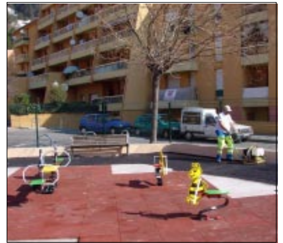
Une aire de jeux pour les tout-petits.

La première tranche de travaux se termine, avec le goudronnage de la chaussée. Elle aura concerné les 300 premiers mètres de la route ainsi que le chemin communal du Bottin. Le réseau d'eaux pluviales a été créé sur une longueur de 150 m et deux murs de soutènement « en caisson » ont été construits, l'un de 60 m de long, l'autre de 15 m. Ils ont la particularité de ne pas retenir l'eau en cas de pluies. Ils évitent ainsi les surcharges sur les ouvrages. Un chantier qui aura coûté 106 000 euros HT, financé à 70 % par le conseil général et à 30 % par la commune.