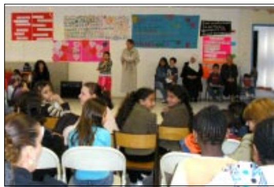
On ne bavarde pas pendant la récitation !

Un bien beau mois de mars à Drap, où l'art s'est mis à la portée de tous.