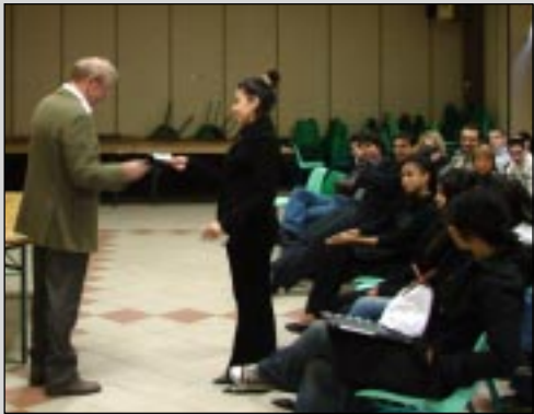
Le maire a remis en main propre la carte électorale aux jeunes de la commune

Un message civique très important à la veille des élections présidentielles et législatives.