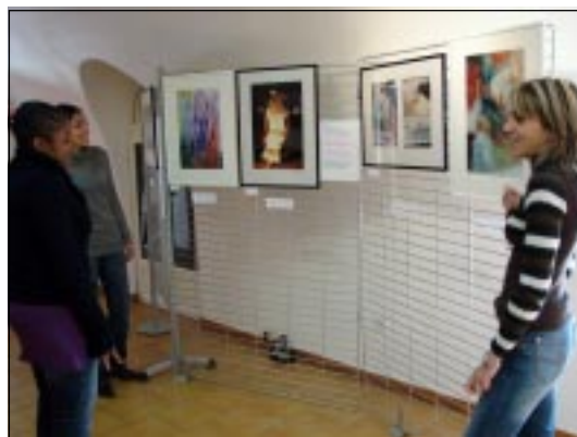
Une exposition appréciée de tous.

Il n'y avait qu'un pas et c'est la compagnie du « Théâtre de la passerelle » qui l'a fait, dans le cadre du Printemps des poètes, avec la représentation de « Rousslan et Ludmilla », le samedi 24 mars, à la salle Maurice Thorez, transformée pour l'occasion en théâtre. L'histoire tirée de l'œuvre de Pouch-