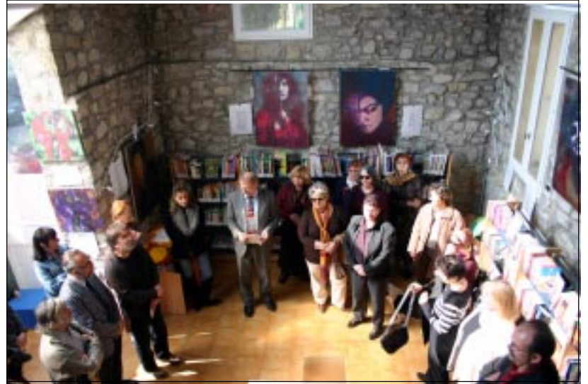
Réception officielle des travaux de la médiathèque de la Condamine.

à la hauteur des activités : réception tous les après-midis des classes du groupe scolaire de la Con-