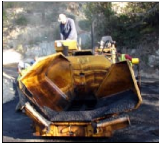
Le « finisseur » pendant la pose de l'enrobé.

La première tranche de travaux se termine, avec le goudronnage de la chaussée. Elle aura concerné les 300 premiers mètres de la route ainsi que le chemin communal du Bottin. Le réseau d'eaux pluviales a été créé sur une longueur de 150 m et deux murs de soutènement « en caisson » ont été construits, l'un de 60 m de long, l'autre de 15 m. Ils ont la particularité de ne pas retenir l'eau en cas de pluies. Ils évitent ainsi les surcharges sur les ouvrages. Un chantier qui aura coûté 106 000 euros HT, financé à 70 % par le conseil général et à 30 % par la commune.