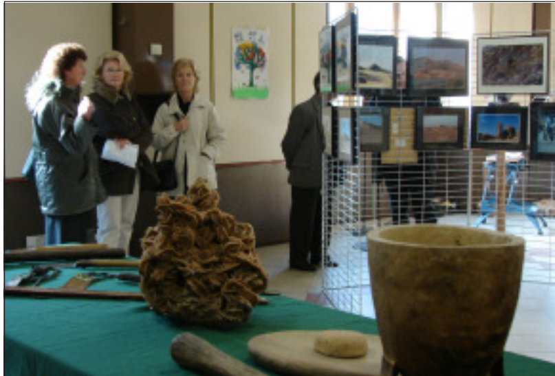
un aperçu des merveilles qu'ont pu offrir les artistes.

Et les Drapois ont été gâtés car la rencontre proposée était de qualité. Des photos sahariennes de Jean-Pierre Michelini, à celles d'Odile où les arbres jouent avec la lumière, en passant par la beauté des paysages du massif du Mercantour, merveilleusement offerte par René Lombard, le voyage était au bout du regard avec en prime les poèmes d'Alain Lefeuvre. Quant aux œuvres de la jeune peintre, Corinne Bertaina, elles ont montré combien les fleurs pouvaient être belles. Un peu plus loin les