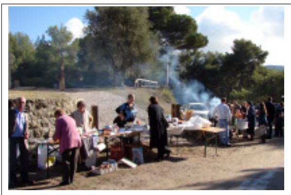
Pique-nique champêtre sur le site de la chapelle Sainte-Catherine.

Mais tout n'était pas fini car la soupe à l'oignon attendait déjà les convives et comme le temps s'était mis au beau, tous ont pu festoyer en plein air dans le cadre merveilleux des hauteurs de Drap.