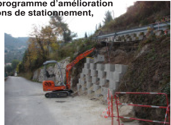
La commune a entrepris des travaux de sécurisation dans divers quartiers.

Il s'agit d'améliorer les conditions de circulation sur l'axe allant aux collines, en rationalisant le stationnement à cet endroit. Le marché dont le coût global s'élève à 40 000 euros, a été attribué à un groupement d'entreprises loca-