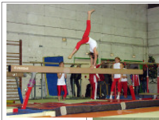
Ci-dessus, une représentation, à la poutre des gymnastes cadettes.