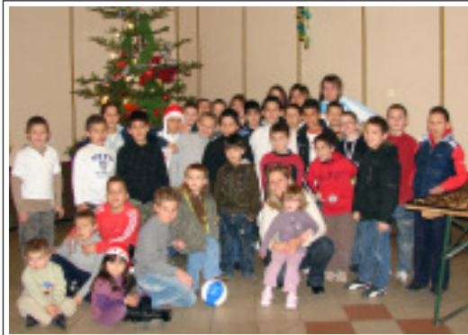
Noël, du bonheur pour nos petits footballeurs en herbe.

Que la fête fût belle pour tous ces enfants. Un rayon de soleil que l'on voudrait planétaire et éternel.