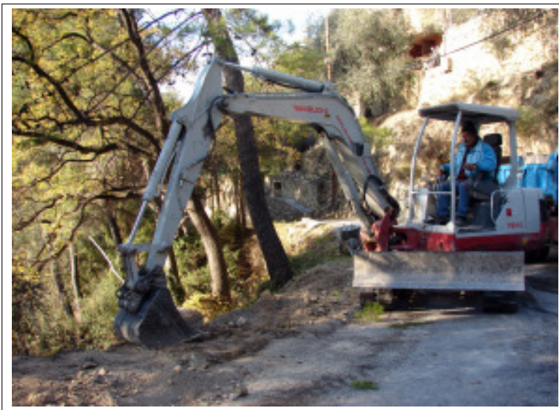
Aménagement du traitement des eaux pluviales au vallon de Terra Bianca.

D'autre part, pour sécuriser la circulation routière, une glissière a été mise