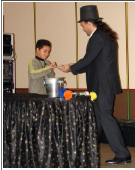
Un tour de cartes pour les enfants de l'OMJCL.