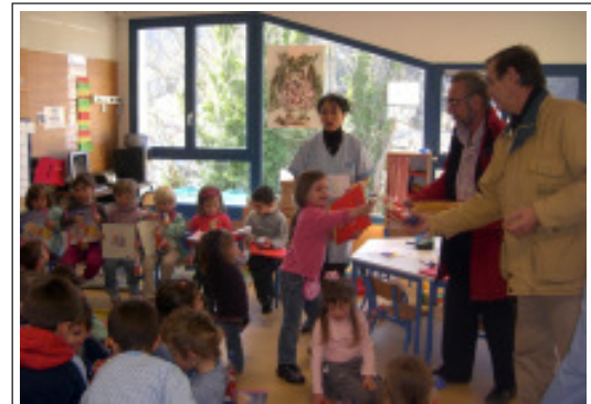
Les élus sont venus remettre des livres à tous les petits écoliers.