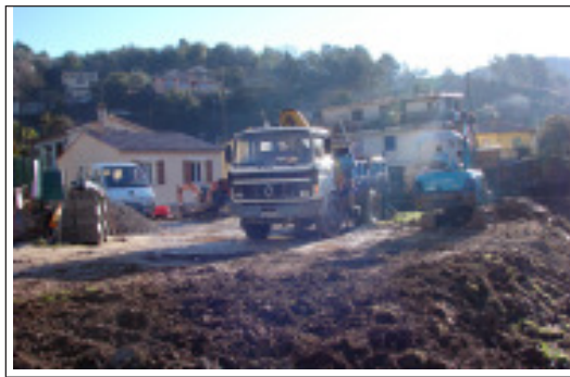
Le Parking Henri Barbusse, maintenant.