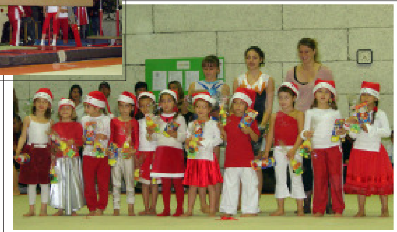
Ci-contre, les poussines et détectives, récompensées après leur prestation au sol.