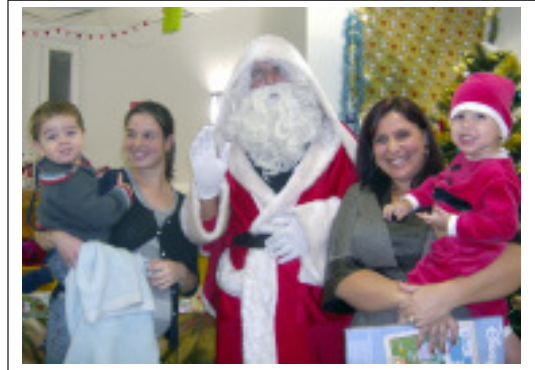
Père-Noël, est passé amener tous ses beaux joujoux aux enfants de la crèche.