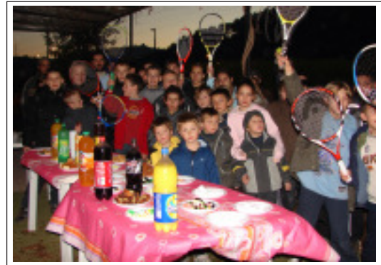
Après un entraînement, rien ne vaut un bon goûter pour fêter Noël.