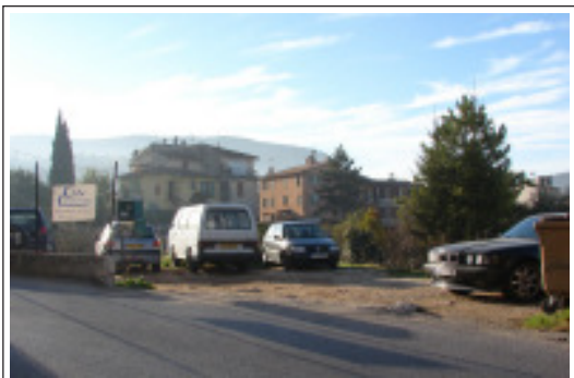
Le parking Henri Barbusse avant.

Le coût des travaux s'élève à 40 569 euros, dont le financement a été couvert à 69 % par le Conseil général des Alpes-Maritimes, le solde restant à la charge de la commune.