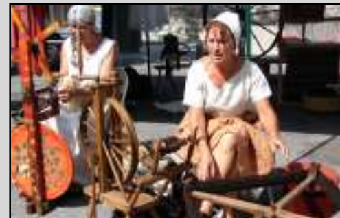
... et les tirelaines ne se sont pas défilées.