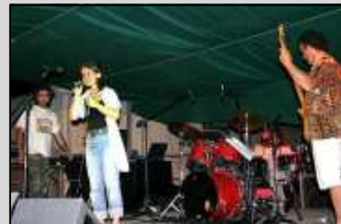
Musique en fête pour la première nuit de l'été

Retour en images sur quelques temps forts de la saison estivale.