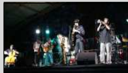
Le festif Barizone Comedia Orchestra.