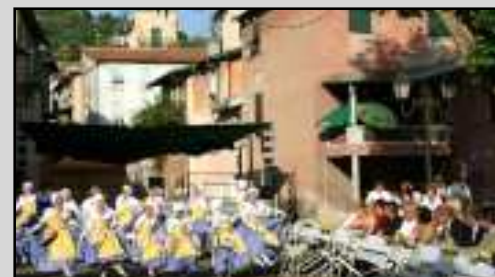
Le festin de Saint-Jean a joué sa partition...