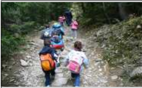
Tiens, le chemin de l'école s'est transformé en randonnée !

Ci-dessous, quelques photos piochées dans l'album de l'école :