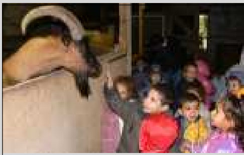
Une halte à la ferme. Je te tiens, tu me tiens, par la barbichette...