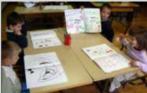
De retour en classe, l'appel des feutres engendre des tableaux bariolés.