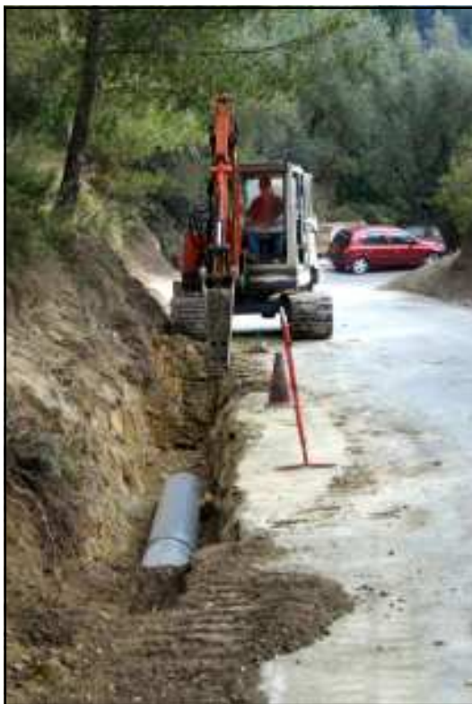
Des canalisations sont en cours d'installation pour empêcher les eaux pluviales de ruisseler sur la route.

Coût de l'opération : 106 000 euros. Le département s'est engagé à hauteur de 74 000 euros, 32 000 euros restent ainsi à la charge de la commune. « Une deuxième tranche de travaux débutera au mois de septembre », précise Serge Pallesco. L'objectif étant d'« équiper une bonne partie des deux kilomètres de chaussée d'ici à la fin de l'année ».