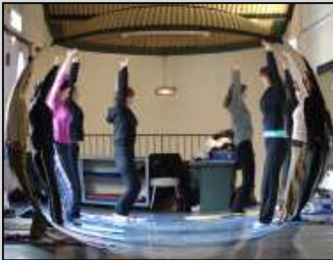
La gym d'entretien, un ballon d'oxygène

L'association drapoise culture sport détente