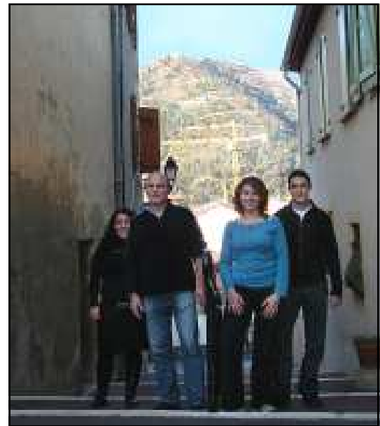
L'équipe d'éducateurs de rue du service Passaj offre une prise en charge des mineurs en difficulté par une présence régulière sur le terrain.

Passaj est mandaté par le conseil général, au titre de l'aide sociale à l'enfance. Les éducateurs travaillent main dans la main avec l'OMJCL. « Notre rôle, c'est d'aider les jeunes à mener des projets individuels ou collectifs. Trouver un stage, créer un atelier de hip-hop, organiser une sortie ciné... Mais rien n'est donné automatiquement nous ne sortons pas les solutions d'un tiroir. »