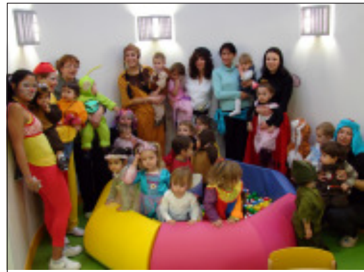
A la crèche, il n'y a que des petits monstres !