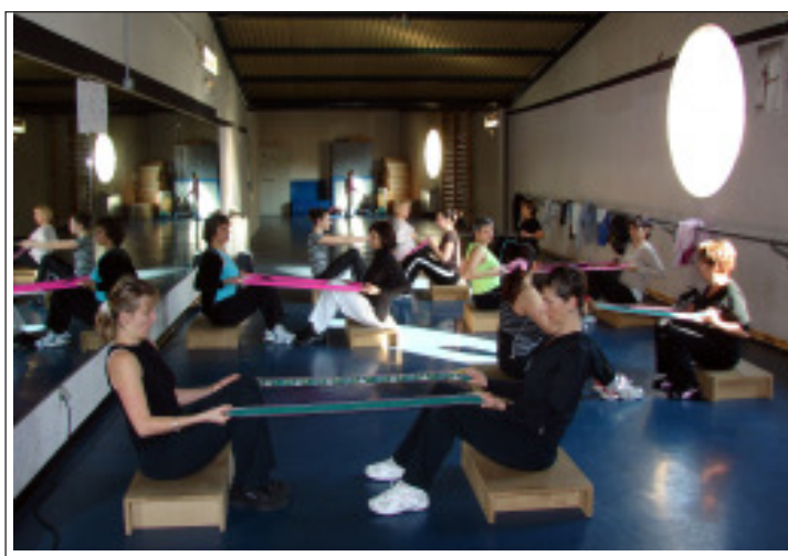
Petit aperçu des cours à suivre lors du stage.

Un programme qui ne manquera pas de séduire beaucoup de monde parmi les 150 adhérents que compte le club.