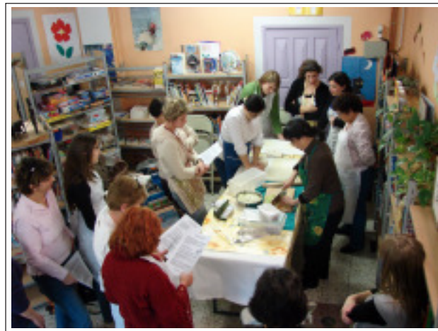
Les élèves apprenties sont très attentives.