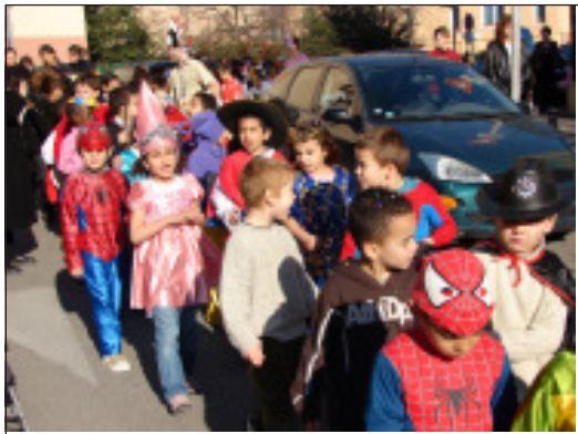
On ne les tient plus, ils se promènent partout dans la Condamine !