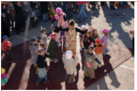
A la maternelle, les enfants ont fait le spectacle avant de déguster un succulent goûter préparé par les parents.