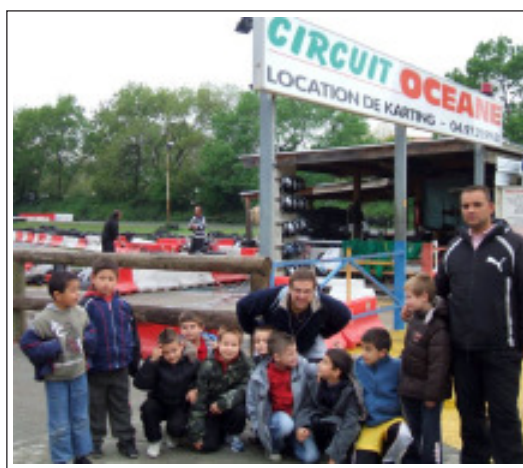
Sortie karting pour les enfants.