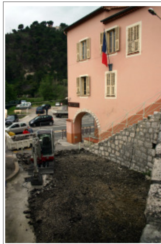
Début des travaux d'extension.

Le coût de cette première phase de travaux se monte à 620 000 € HT, dont 40 % du financement doit être assuré par l'Etat, au titre de la dotation générale d'équipement des communes, et 30 % par le conseil général.