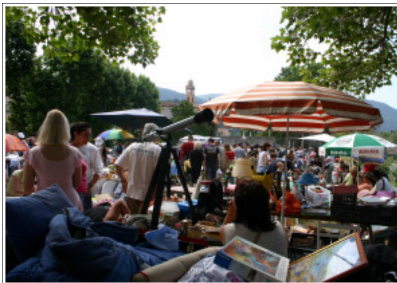
Rendez-vous dimanche 1 er juin.

A midi, un apéritif d'honneur sera offert