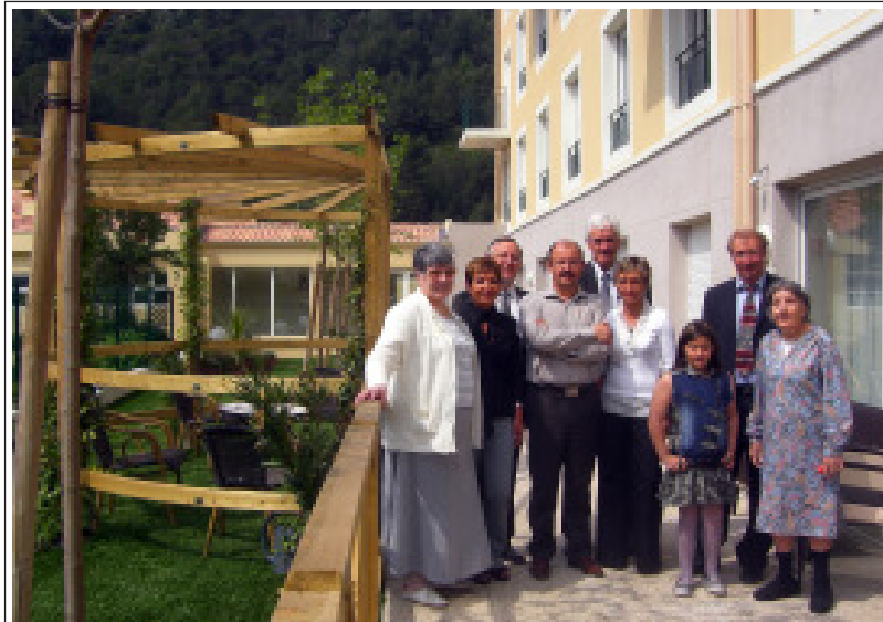
Le centre de convalescence du pays des Paillons tient déjà une place importante dans notre vallée.

peuvent bénéficier d'une salle de sport et pratiquer des activités en fonction de leurs goûts et de leurs aptitudes physiques et in-