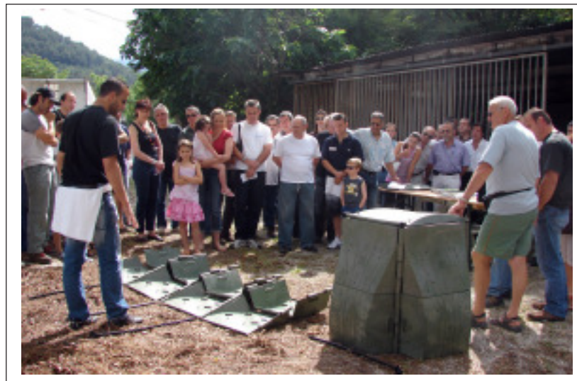
Démonstration de la construction d'un composteur.

Il faut savoir que le compostage domestique de la partie fermentescible d'une poubelle représente environ 30 % des déchets ménagers et que la transformation de ces déchets organiques va permettre d'obtenir sans difficulté un compost comparable à l'hu-