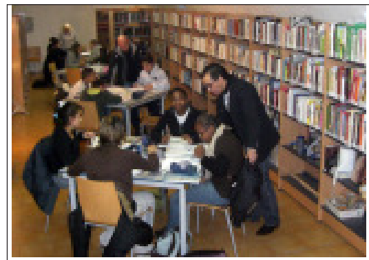
Ambiance studieuse !

nes de 9 à 16 ans et nous aidons chaque année 100 à 150 élèves, ce qui représente 30 à 35 élèves par éducateur. Les enfants nous connaissent, ce qui rend notre démarche plus facile. Après deux années d'expérience, il est encourageant de constater la prise de conscience des parents et des jeunes, ce qui nous conforte dans l'idée de pérenniser l'accompagnement scolaire afin de soutenir les collégiens et leurs parents ». A noter que pendant le