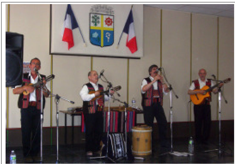
Animation musicale assurée par le groupe Apurimac.

Pour deux journées la salle Maurice Thorez s'est ornée d'objets, traditionnels, témoins d'une civilisation toujours vivante et qui se bat pour conserver ses racines. Favoriser la diffusion d'œuvres d'artisans péruviens en respectant la culture traditionnelle et les droits de l'homme, telle est l'action de l'association. Et puis la musique traditionnelle péruvienne du groupe Apurimac a rempli la salle d'exposition de notes sorties d'instruments ancestraux : cuatro (petite guitare à 4 cordes), charango (guitare à 10 cordes), bombo (per-