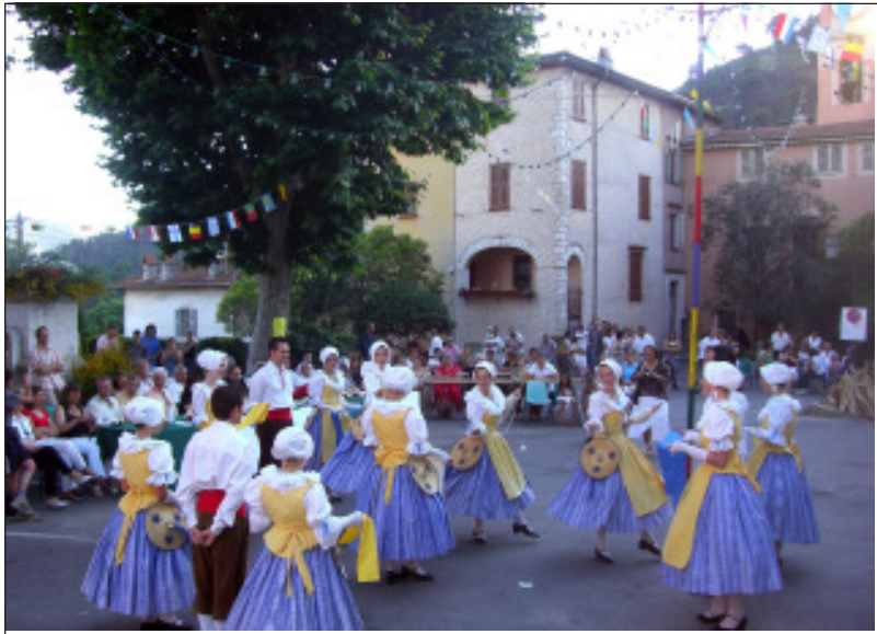
Démonstration de pas de danse par la Parpaïola.