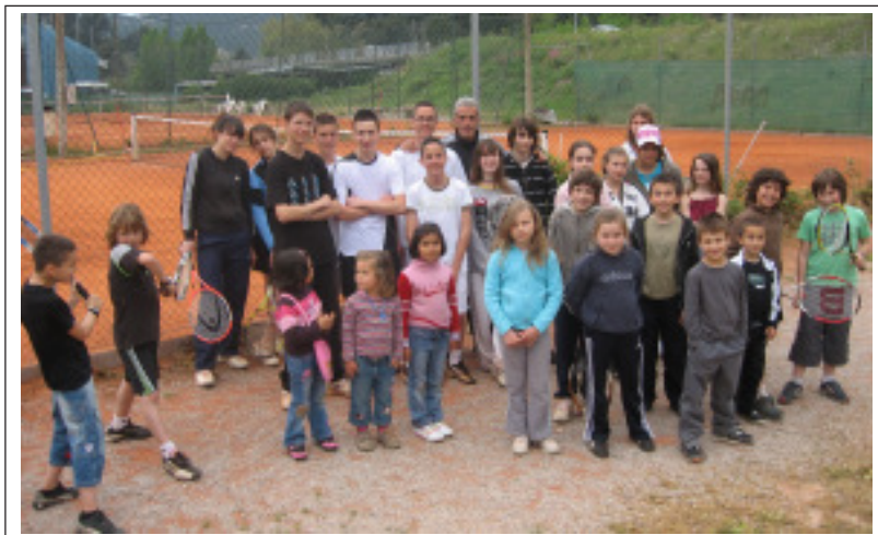
L'équipe de tennis, impatiente de taper la balle sur la terre battue.