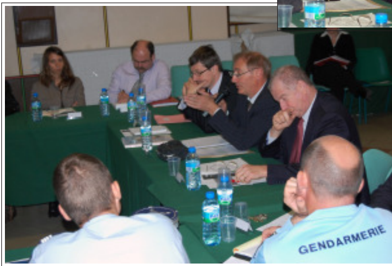
Séance plénière constructive, à la salle Maurice Thorez.

L'échange d'information entre les responsables des institutions et organismes publics et privés seront favorisés et auront pour objectif communs la préservation de la sécurité et de la tranquillité publiques.