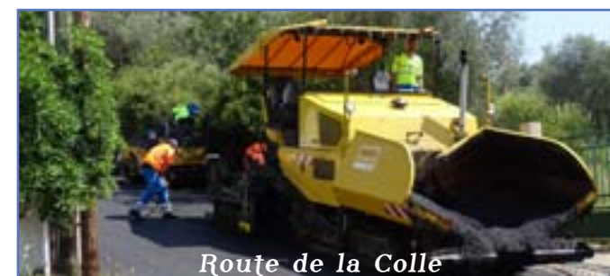
Route de la Colle