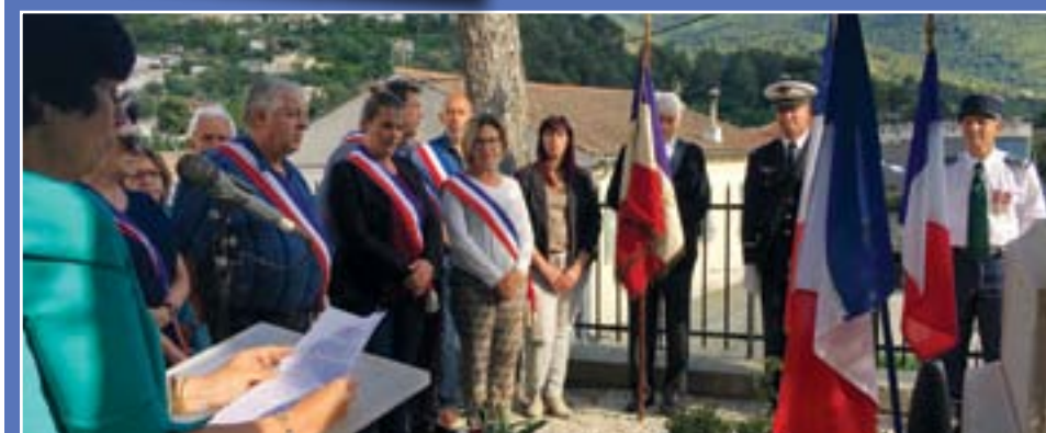
8 juin, Hommage aux Morts pour la France en Indochine