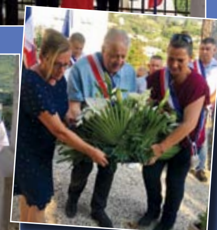
18 juin, Appel du Général de Gaulle