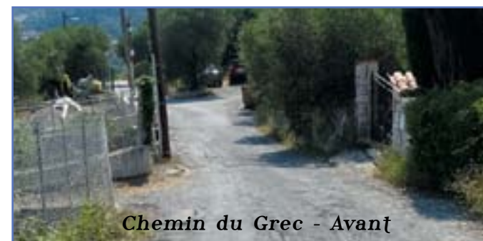
Chemin du Grec - Avant