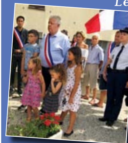
14 juillet 2018, Fête nationale