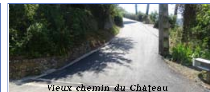
Vieux chemin du Château