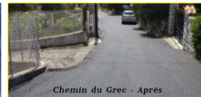
Chemin du Grec - Après