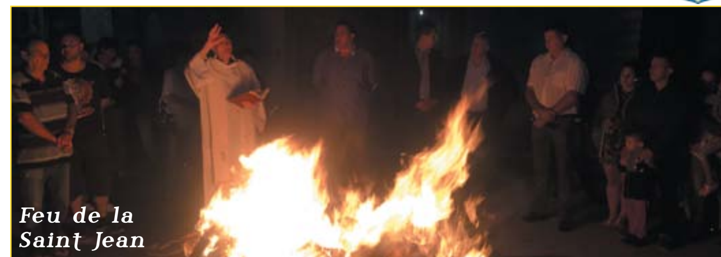
Feu de la Saint Jean