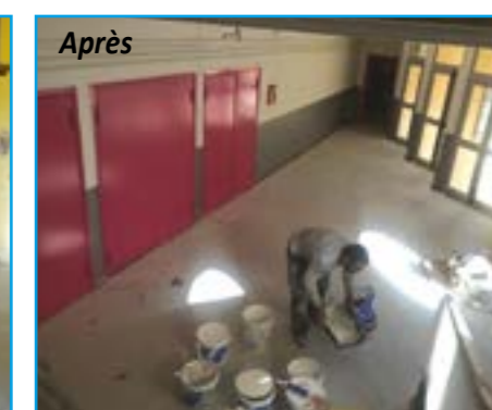
Pose de nouvelles portes