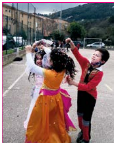
Jdd n°51-Janvier/mars 2021