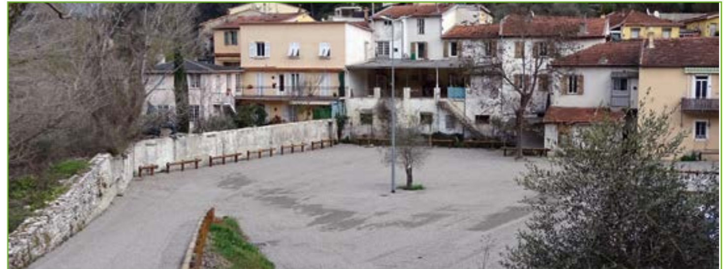
Le parking aménagé face à la résidence Fleur de Lin Boulevard Stalingrad sera prochainement ouvert.

La crise liée à la COVID-19 semble perdurer, elle freine l'activité économique et sociale. Cependant, la Municipalité entreprend des actions pour continuer à dynamiser le village.