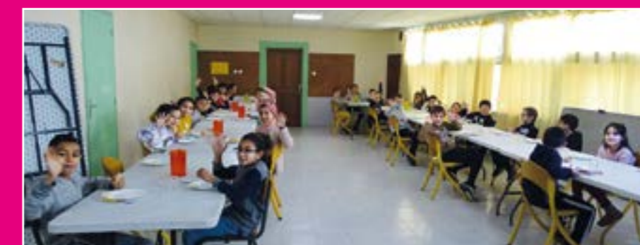
Jdd n°51-Janvier/mars 2021

À l'image du 18 janvier, quand les enfants devaient s'attabler par classe pour déguster leur repas.