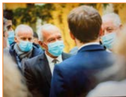
projets menés par la Municipalité.