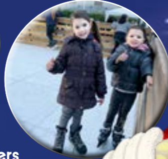
Distribution des calendriers de l'Avent aux écoliers