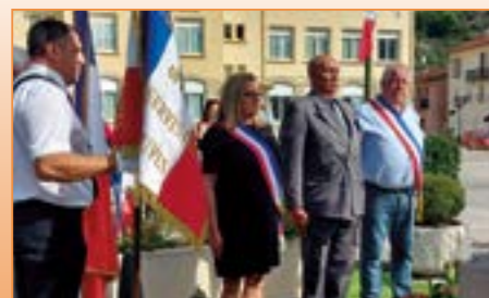
25/09, Journée nationale d'Hommage aux Harkis et autres membres des formations supplétives