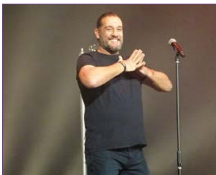
Humour avec Titoff le 10 décembre