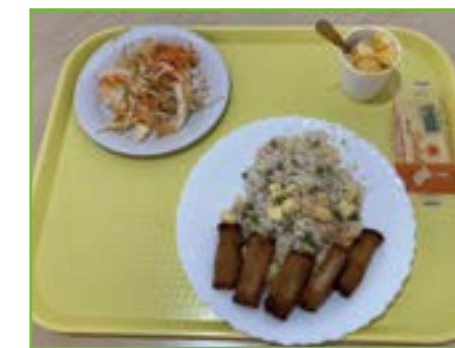
Le menu chinois suggéré par les enfants.

À La Condamine, le goûter « carnavalesque » s'est déroulé le 4 mars. Les parents d'élèves, dont certains sont membres du Conseil