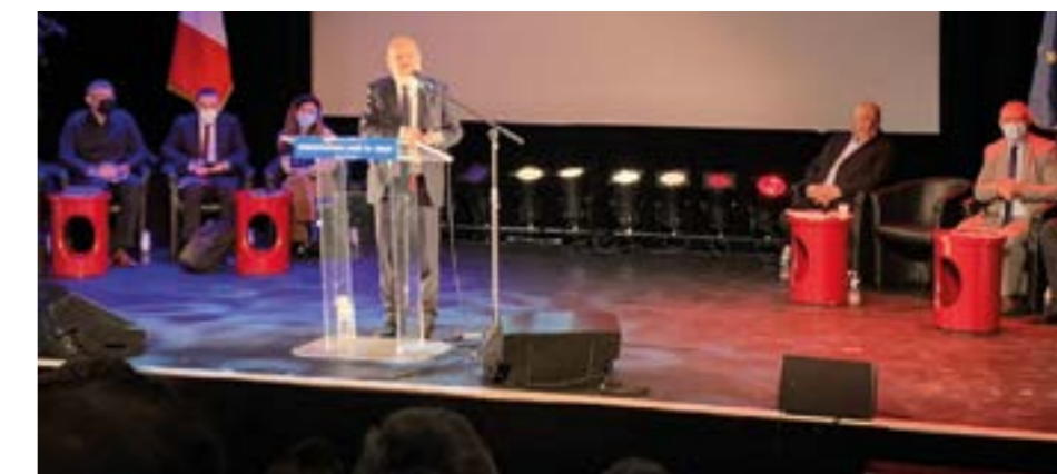
Lors de la réunion publique

Courant mai, ce bilan sera remis par ce cabinet avant la présentation au conseil métropolitain de juin, qui en délibérera et arrêtera le projet définitif.