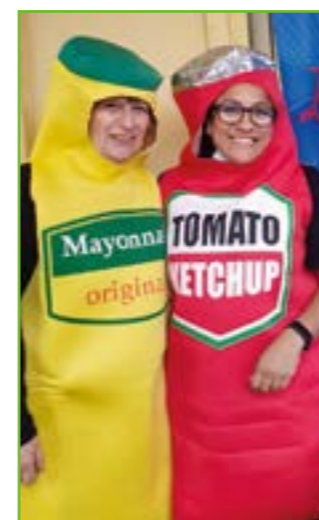
Joie et sourires devant l'école Pierre Cauvin à La Condamine

Rendez-vous sur le site de la Ville, www.ville-drap.fr pour découvrir les permanences et télécharger les documents à retourner avant le 29 avril pour l'école et le 27 juin pour la restauration scolaire. Infos au 04 97 00 06 30 .