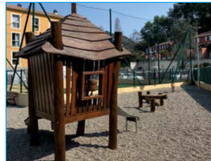
En haut, le jardin d'enfants Rives du Paillon s'est refait une beauté... tout comme celui de La Condamine (en bas à gauche) et celui des Résidences du Vallon (en bas à droite).