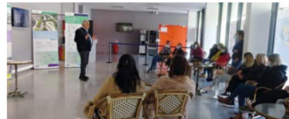
Avec les employés municipaux