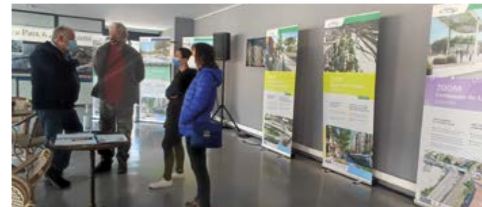
Avec la population

La concertation s'est achevée le 11 mars. A présent, le recueil et l'analyse des observations sont effectués par un bureau d'études indépendant. Ce cabinet a la tâche d'analyser l'ensemble des contributions afin de conforter, infléchir ou corriger le projet de la ligne 5 et de s'adapter au mieux aux circonstances locales.