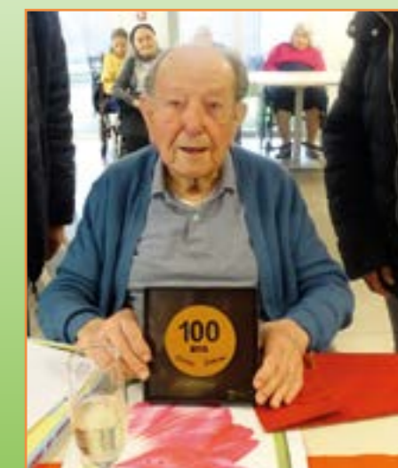
Joyeux anniversaire !