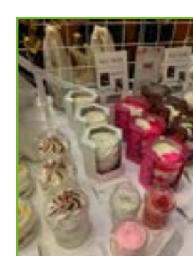
Au Salon Bioforme, il y avait de quoi vivre des expériences inédites, aussi bien grâce aux animations proposées qu'aux produits présentés par les exposants.