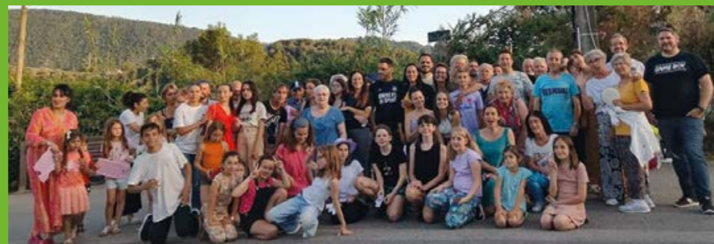
Nombreux voisins réunis Route de La Colle