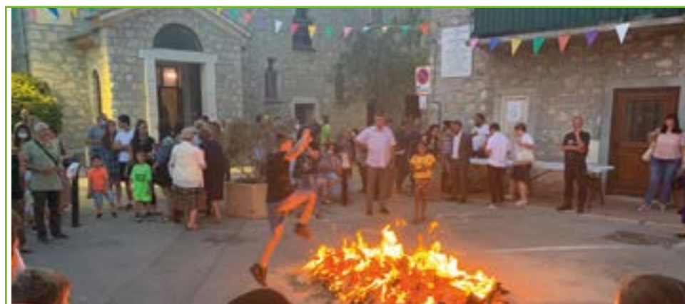
Etes vous prêts à sauter le feu vendredi?

Les structures gonflables en libre accès régaleront vos enfants samedi après-midi !