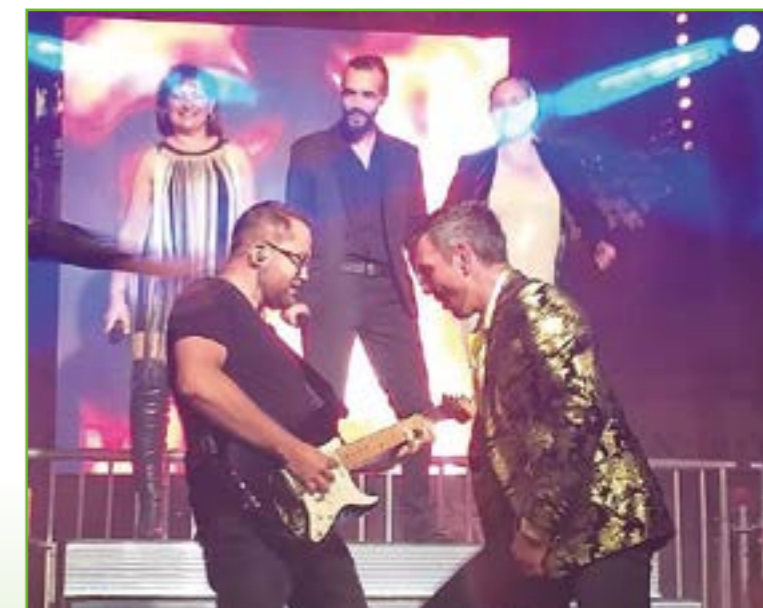
Les bals gratuits promettent un beau spectacle avec les grands orchestres programmés. Almeras Music Live jouera le vendredi (ci-dessus) et LSP le samedi (ci-contre)