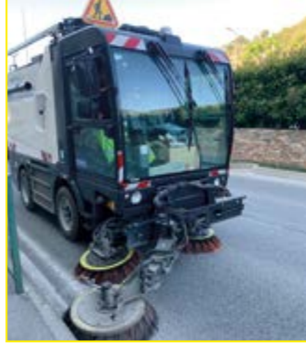
Ci-dessus, la balayeuse