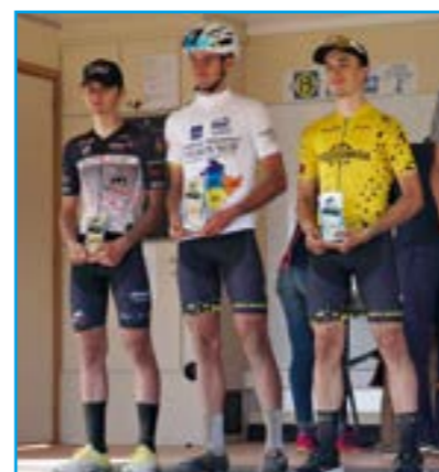
Les champions PACA