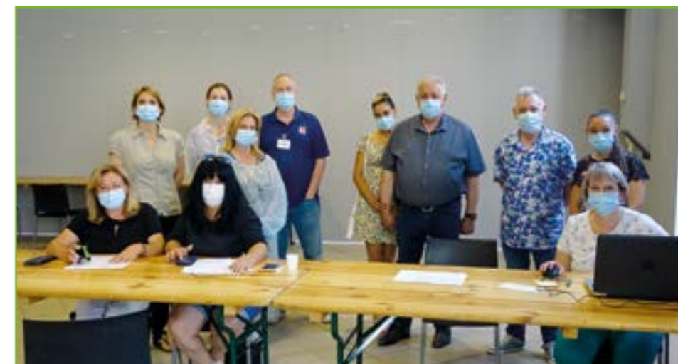
Ci-dessus, les acteurs de la campagne de vaccination.

Merci à tous les partenaires qui accompagnent la Municipalité dans son action !