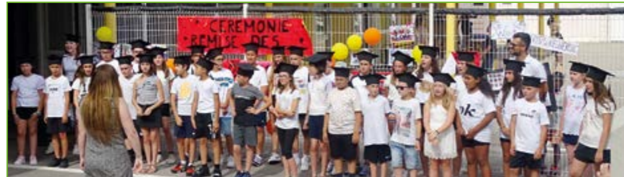
L'école Romain Knecht avait organisé une vraie cérémonie de fin d'études pour les élèves de CM2 avec chorale et goûter !