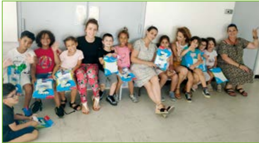
Ardoises pour les élèves passant au CP, calculatrices pour les élèves allant au collège