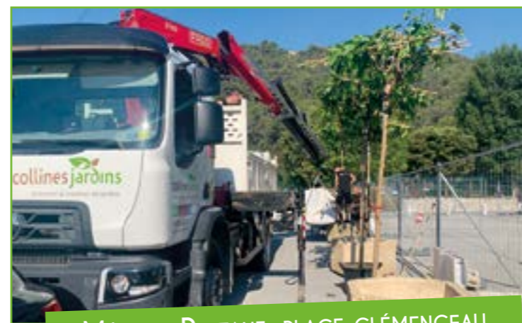
MÛRIERS PLATANE, PLACE CLÉMENCEAU