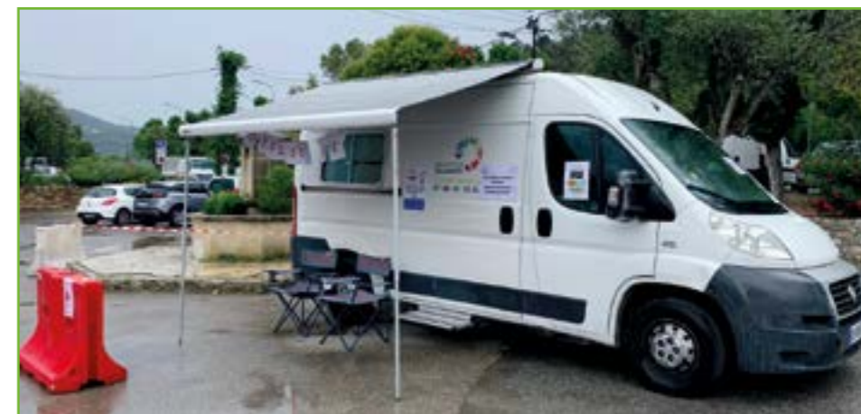
Ci-dessous, le bus du dépistage du groupe SOS Solidarités