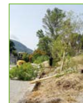
POIVRIERS ET CANFRIERS, PLATEAU SPORTIF DU VILLAGE