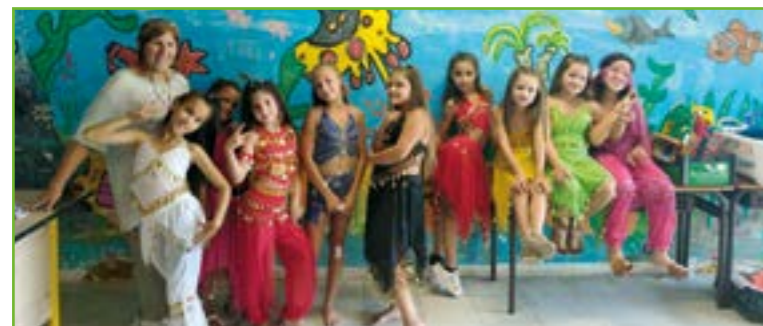
A l'école Pierre Cauvin, on a célébré la fin d'année avec goûter, jeux et spectacle !