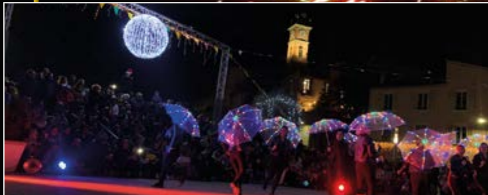
Spectacle de Let's dance et boissons chaudes offertes à la population