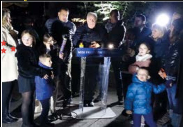
Compte à rebours, illumination du village et feu d'artifice