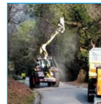
Chemin de l'Ubac