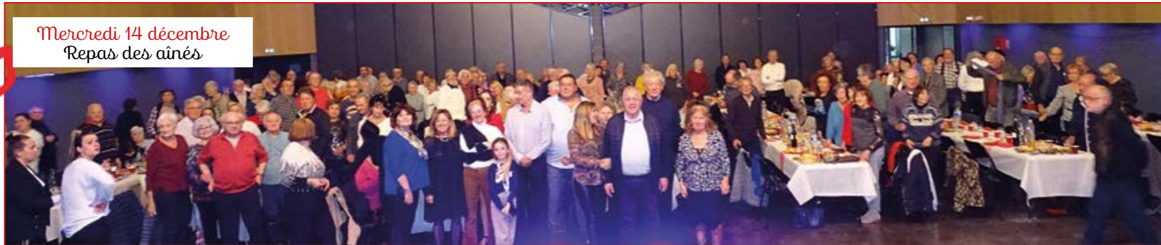
Mercredi 14 décembre Repas des aînés