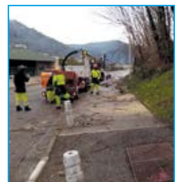
Route du Lycée