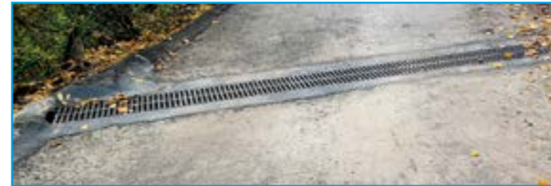
Grilles d'eaux pluviales Route des Croves, Ubac et Croisement La Colle / Route du château et Montée du Grec et Vallon des Arnulf