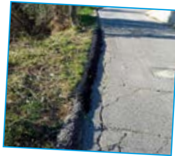
Bourrelets à goudron chaud Route Sainte Catherine