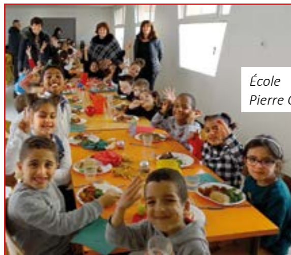
École Pierre Cauvin