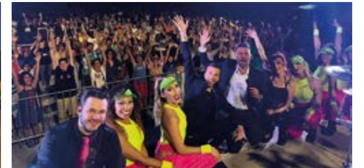
Promenades à poney avec le Jas des rocs, structures gonflables gratuites au Plateau sportif et dans la cour de l'école Pierre Cauvin avec Murta Events, cérémonie du feu célébrée par le Père Jérémie Place de la Libération, suivie du 2 ème bal gratuit avec l'orchestre Almeras au Plateau sportif.