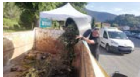
Le 10 juin, de nombreux drapois ont déposé leurs déchets verts dans la plateforme mobile de collecte de la Métropole Nice Côte d'Azur. Pierre-Paul Léonelli, adjoint au maire de Nice délégué à la propreté, vice-président de la Métropole Nice Côte d'Azur a distribué des composteurs. Cette dernière opération se renouvellera le 7 octobre, inscrivez-vous !