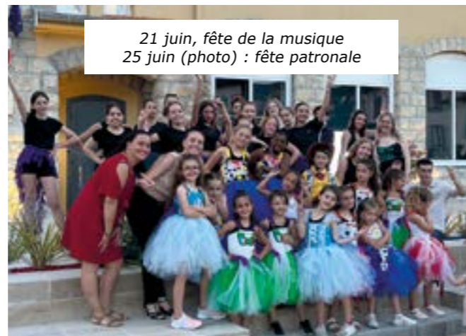
21 juin, fête de la musique 25 juin (photo) : fête patronale

MERCI POUR VOTRE INVESTISSEMENT AUPRÈS DE LA MAIRIE !