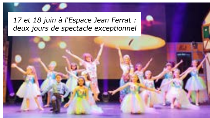
17 et 18 juin à l'Espace Jean Ferrat : deux jours de spectacle exceptionnel