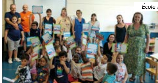
École Pierre Cauvin

Comme chaque année, la Municipalité de Drap a offert des cadeaux aux enfants qui changent de cycle : les futurs élèves de CP ont eu droit à des ardoises et les futurs élèves de 6 e des calculatrices !