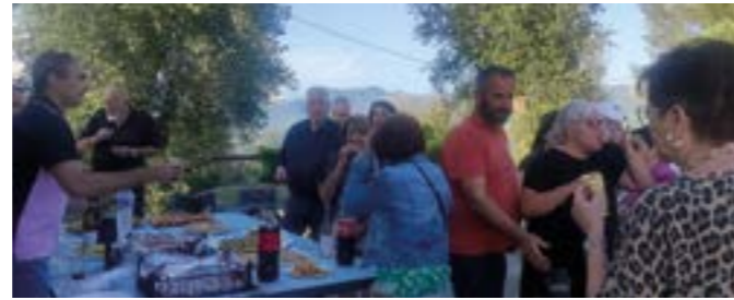
Fête des voisins