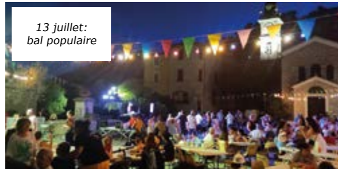
13 juillet: bal populaire

Comme lors des deux bals de la fête patronale (photo en haut), l'association Fêtes et Traditions Drap a aussi assuré la buvette lors des spectacles qui se sont tenus à l'Espace Jean Ferrat dans le cadre des « Soirées estivales » du Conseil Départemental des Alpes-Maritimes. Retrouvez les membres de l'association le 28 juillet , pour l'ultime « vendredi terrasse » de l'été et le 28 août à partir de 19 h pour la fête de la Libération de Drap ! Renseignements : 06 36 94 53 52