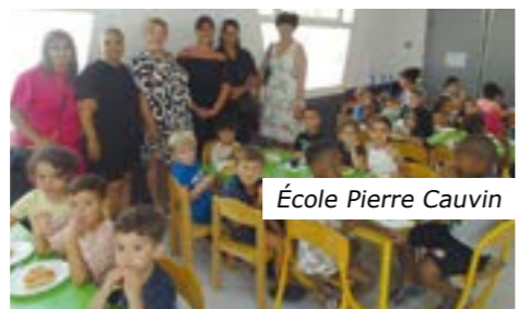
École Pierre Cauvin

La Municipalité a aussi mis du bonheur dans les assiettes des enfants, avec un menu festif pour la fin d'année. Tous en ont profité !