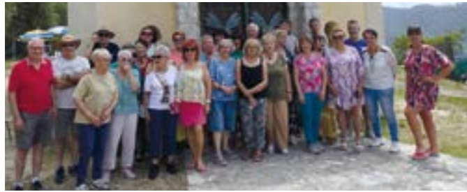
Les membres du Comité de Jumelage de Drap ont fêté la fin de l'année scolaire du cours d'italien de l'association dans l'amitié et la bonne humeur.