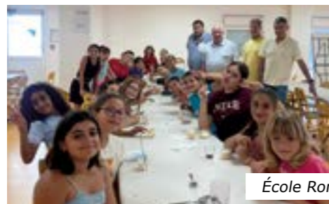
École Romain Knecht