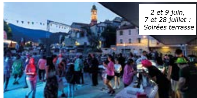
2 et 9 juin, 7 et 28 juillet : Soirées terrasse