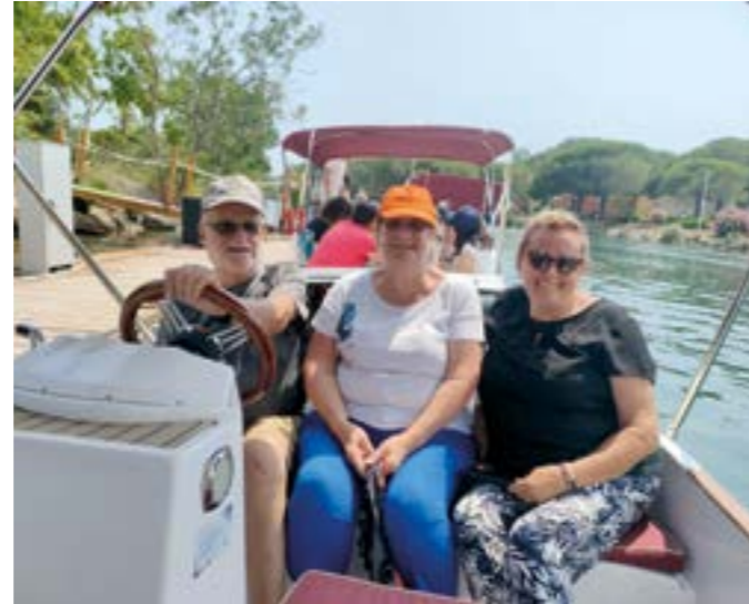
Le CCAS a emmené les aînés drapois à Mandelieu pour quelques emplettes au marché et une balade en bateau sur la Siagne et à Tende, à la découverte du village et du Musée des Merveilles.