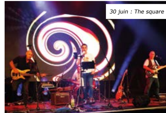
30 juin : The square