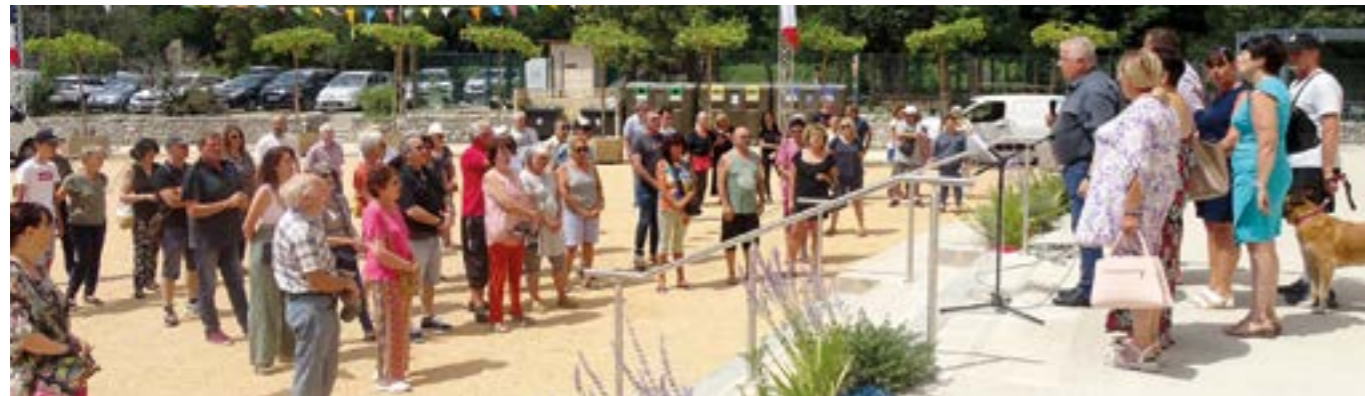
3 Juillet, parvis de la Mairie. Suite aux émeutes dans le pays, l'Association des Maires de France a appelé les Maires des communes à réunir les habitants de leur commune sur le perron de chaque mairie demain lundi 3 juillet à midi pour partager l'Appel des maires de France pour le retour à la paix civile.