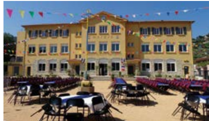
L'embellissement de la Place Clemenceau, désormais revêtu d'un bi couche ocre, rend encore plus majestueux le bâtiment réhabilité. Avant la cérémonie protocolaire, les élus ont fait découvrir ses locaux de la mairie aux Drapois

Le 25 juin, de nombreuses personnalités et autorités ont partagé avec les élus de Drap, les élus du Conseil Municipal Enfants et la population des moments importants que furent l'inauguration de deux nouvelles infrastructures dans le village : la nouvelle Mairie et la Traverse Arnulf, première voie perméable réalisée par la Métropole Nice Côte d'Azur.