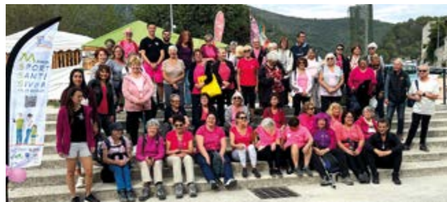
En partenariat avec le SIVOM Val de Banquière, intervention de l'infirmière DE et tatoueuse, spécialiste de l'esthétique réparatrice artistique.

16/10 ACTION OCTOBRE ROSE EN FAVEUR DU DÉPISTAGE DU CANCER DU SEIN