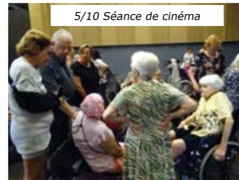
5/10 Séance de cinéma