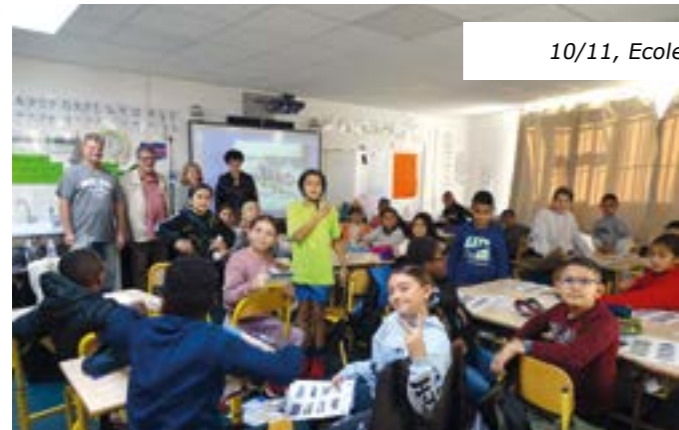
10/11, Ecole Pierre Cauvin