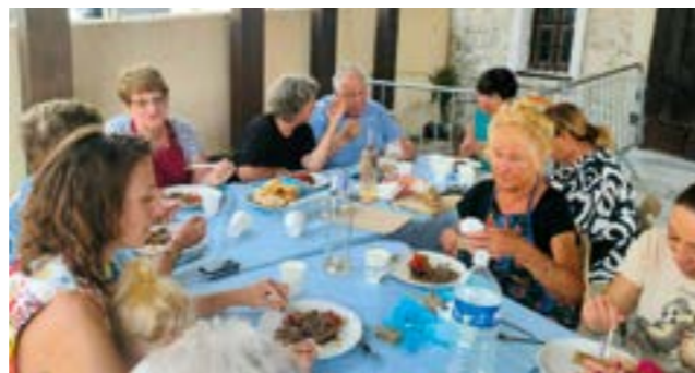
4/10 Atelier cuisine en partenariat avec l'association le Savoir-faire partagé.

16/10 ACTION OCTOBRE ROSE EN FAVEUR DU DÉPISTAGE DU CANCER DU SEIN