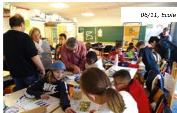
06/11, Ecole Romain Knecht