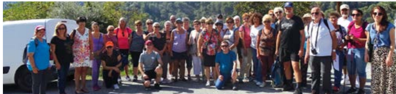
3/10, Marche en partenariat avec l'USC Drap et le SIVOM Val de Banquière qui a offert des podomètres aux participants