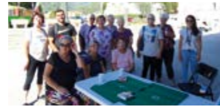
2/10, Atelier équilibre en partenariat avec le SIVOM Val de Banquière, goûter et jeux de cartes