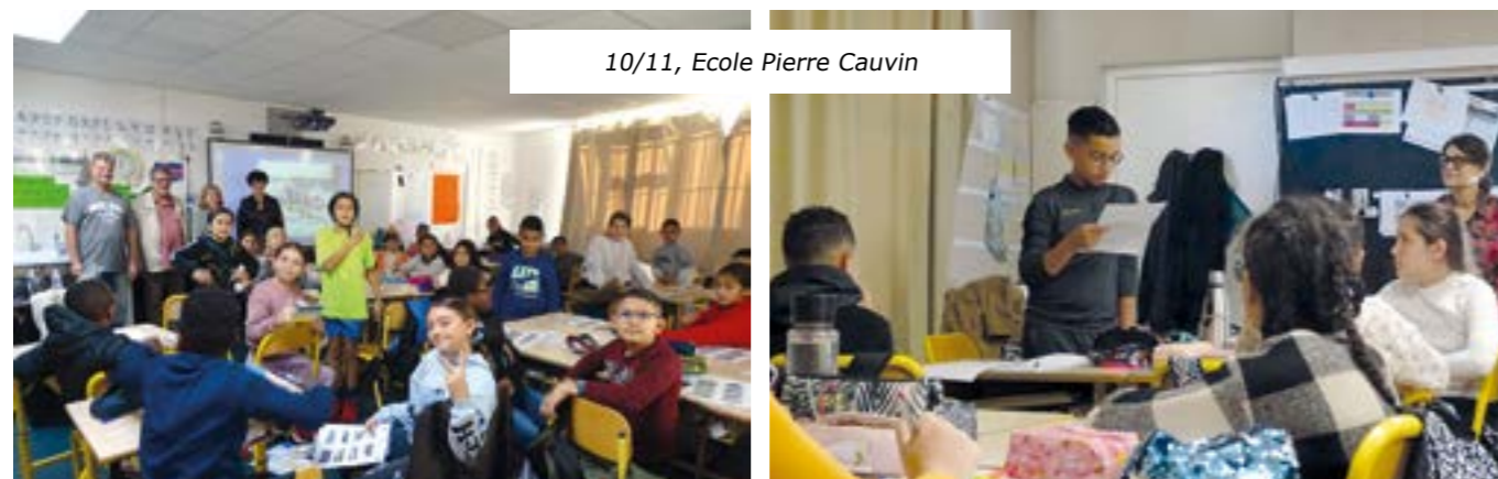
10/11, Ecole Pierre Cauvin

11/11, 10 H 30 : DÉPÔT DE GERBES AU PIED DES DEMEURES DES POILUS DRAPAIS ET AU MONUMENT AUX MORTS À 11 H 00