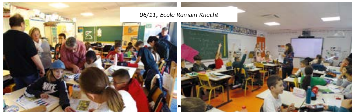
06/11, Ecole Romain Knecht