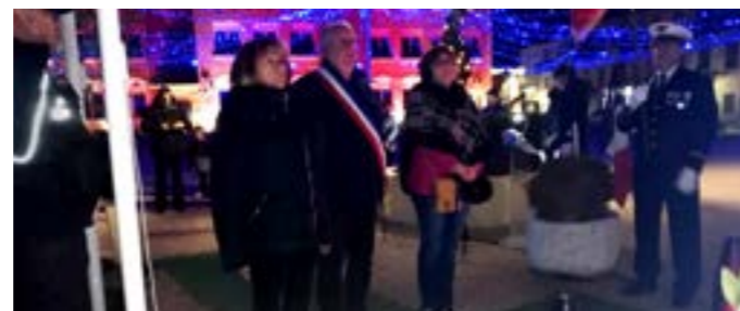
Le 5 décembre, a rendu un hommage aux Morts pour la France pendant la guerre d'Algérie et les combats du Maroc et de la Tunisie