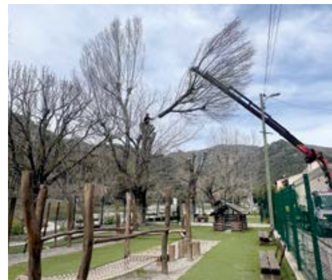
Au Centre village au jardin d'enfants Rives du Paillon