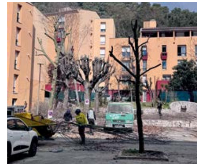
Avenue Virgile Barel à La Condamine