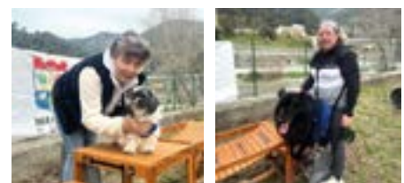
Les toutous, avec ou sans leurs maîtres ont posé pour le souvenir d'un jour dédié au bien-être animal !