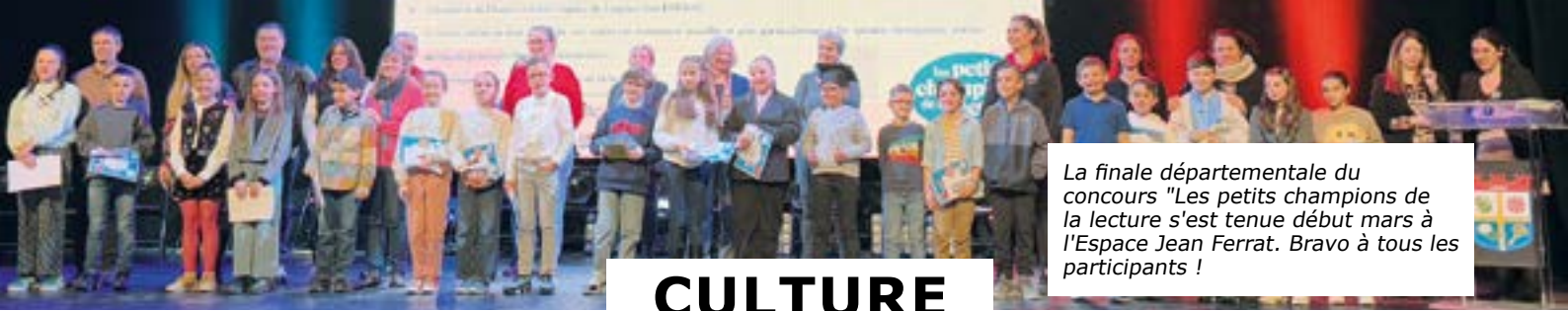
La finale départementale du concours "Les petits champions de la lecture" s'est tenue début mars à l'Espace Jean Ferrat. Bravo à tous les participants !