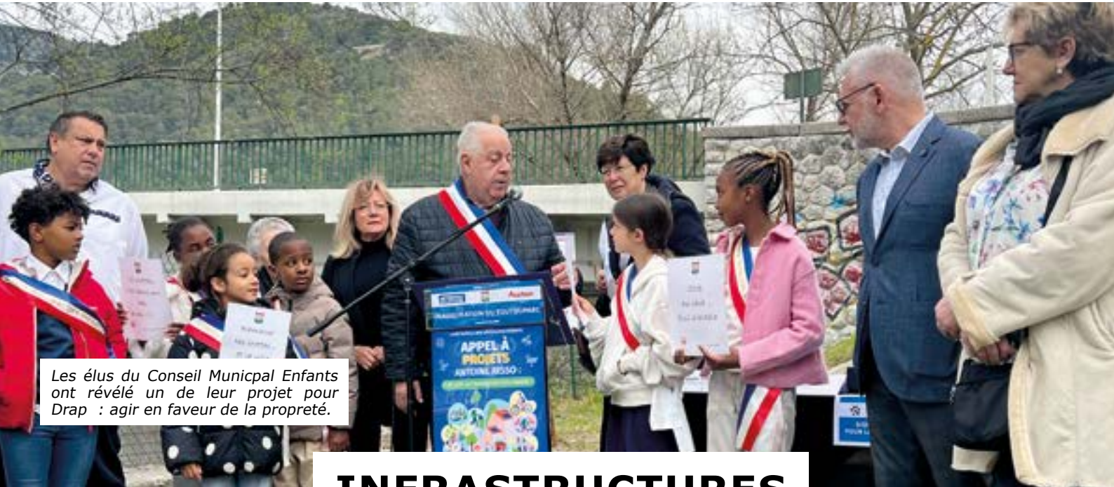
Les élus du Conseil Municipal Enfants ont révélé un de leur projet pour Drap : agir en faveur de la propreté.