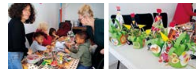
"Petit atelier du réseau parentalité", "J'attends Pâques"