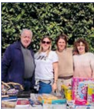
La journée « Jeux Bouquine » organisée par la Commune de Drap a tenu ses promesses, avec de multiples ventes ou échanges entre exposants et visiteurs. Merci aux associations "Drap aux Pitchouns" qui a tenu la buvette et à "Let's dance" qui a proposé une zumba party, au profit du Défi bleu, une collecte de fonds initiée par la Commune en faveur de la sensibilisation au dépistage du cancer colorectal.