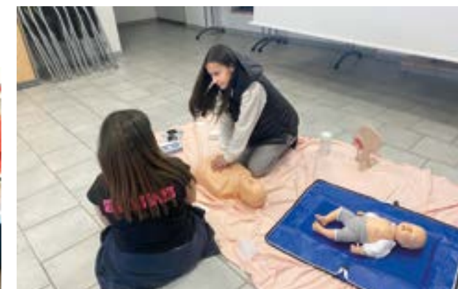
Formation aux premiers secours