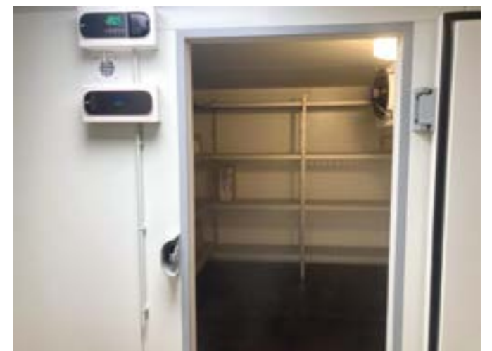
Une chambre froide négative a été installée au sous-sol de la cuisine centrale.