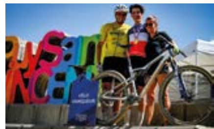
Azur Bike Events

aux associations drapoises qui portent haut les couleurs drapoises le 11 janvier lors des vœux à la population