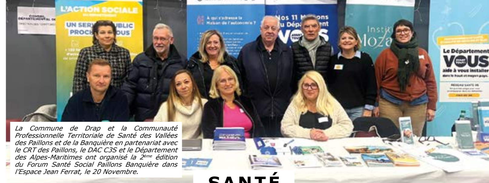
La Commune de Drap et la Communauté Professionnelle Territoriale de Santé des Vallées des Paillons et de la Banquière en partenariat avec le CRT des Paillons, le DAC C3S et le Département des Alpes-Maritimes ont organisé la 2 ème édition du Forum Santé Social Paillons Banquière dans l'Espace Jean Ferrat, le 20 Novembre.

Les rendez-vous se tiennent le 1 er mardi de chaque mois de 9h à 12h et de 13h30 à 16h30 en Mairie.