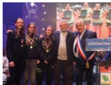
Tennis Municipal de Drap