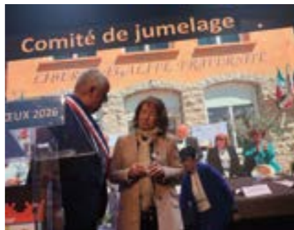
Comité de jumelage