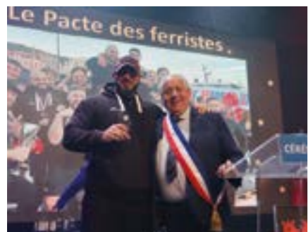
Le Pacte des ferristes