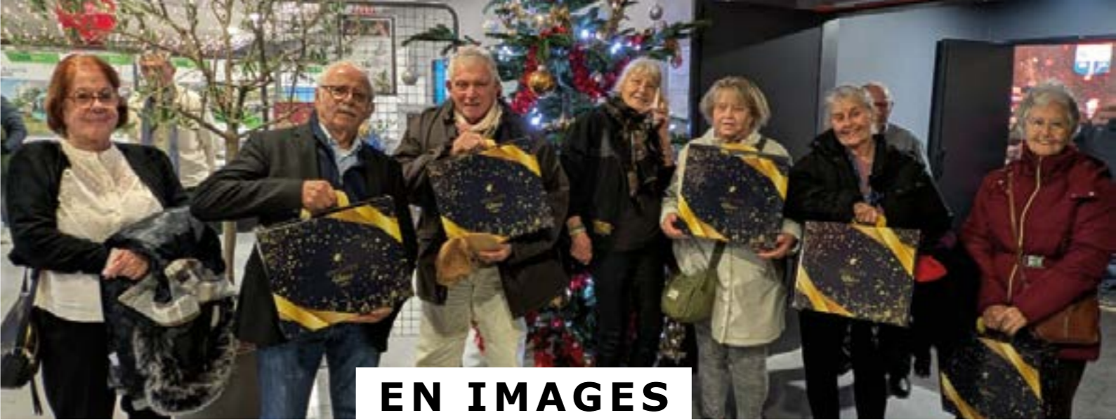
et des gourmandises à déguster offert par le CCAS !