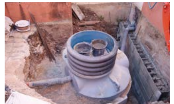
Le bac à graisse a été changé, ainsi que toute l'installation de plomberie qui y est reliée. Sa capacité a été augmentée.

La Commune s'engage en faveur de la qualité des repas servis et de l'amélioration des conditions de travail des employés. Son investissement pour la cuisine centrale de La Condamine s'élève à près de 80 000 €, avec une participation de l'Etat au titre de la Dotation d'Equipeement des Territoires Ruraux 2025.