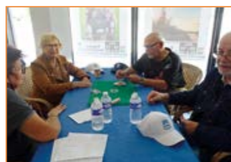
Après-midi pétanque et cartes