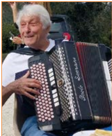
Pique-Nique à Sainte Catherine