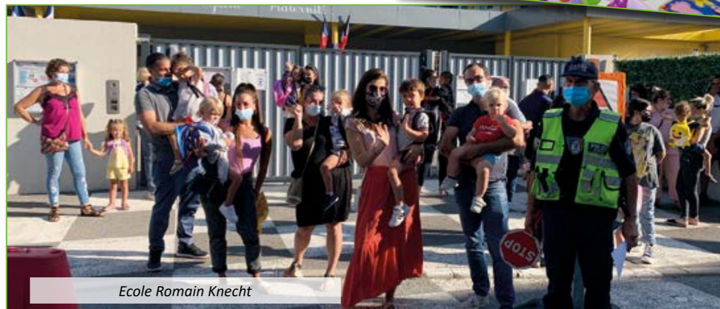
Ecole Romain Knecht