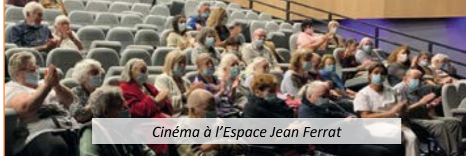
Cinéma à l'Espace Jean Ferrat

Dans le cadre de la semaine bleue, la Ville de Drap et le CCAS ont organisé plusieurs animations début octobre. L'objectif de la manifestation, lancée en 1951, est de montrer le rôle social des anciens et de créer du lien social entre les générations.