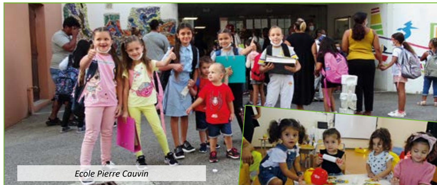
Ecole Pierre Cauvin

petit effectif afin de consolider les savoirs fondamentaux et combler leurs lacunes.